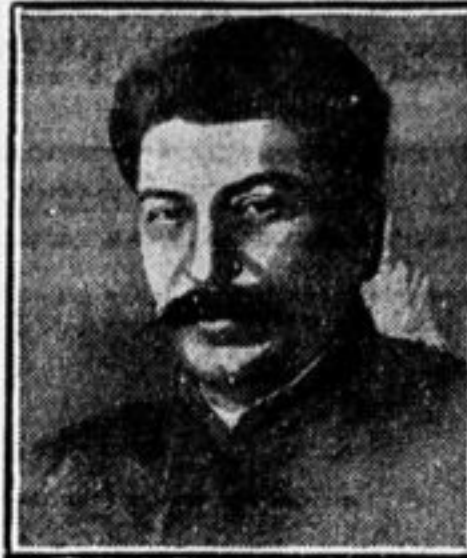
Тов. Сталин (ген. секр. ЦК ВКП(б)).

Война, как известно, расшатала хозяйство всех европейских стран. Ранее процветала промышленность, процветала и торговля. Во время империалистической войны промышленность за мерла, торговые связи оборвались. Когда война кончилась, все буржуазные государства напрягли все усилия, чтобы восстановить разрушенное хозяйство. Это им удалось. Производство капиталистических стран за истекшие два года перешагнуло за довоенные нормы, а в таких странах, как Северо-Американские Соединенные Штаты, уже составляет приблизительно 150 процентов по сравнению с довоенным.