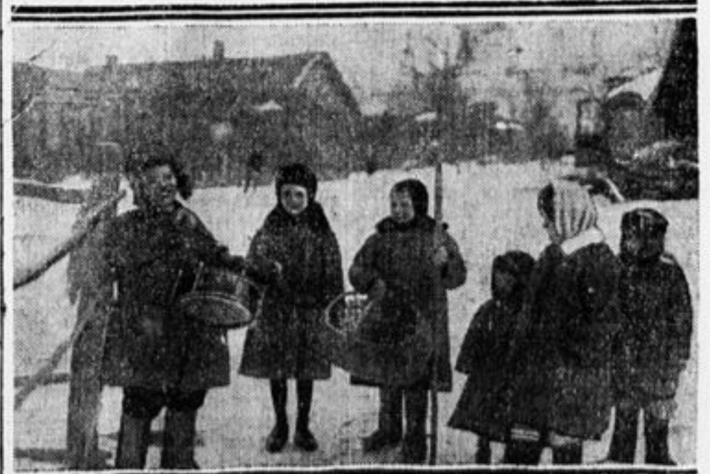
На дробь барабана—собирается отряд.