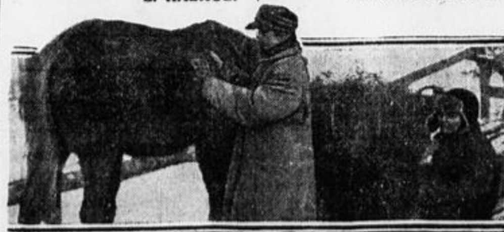
Ежедневно чистит лошадь.

обещал нам в этом помочь. Впереди еще много интересной работы.