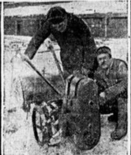
Ручной трактор. Получен на днях из Германии в сельхоз МЗО.