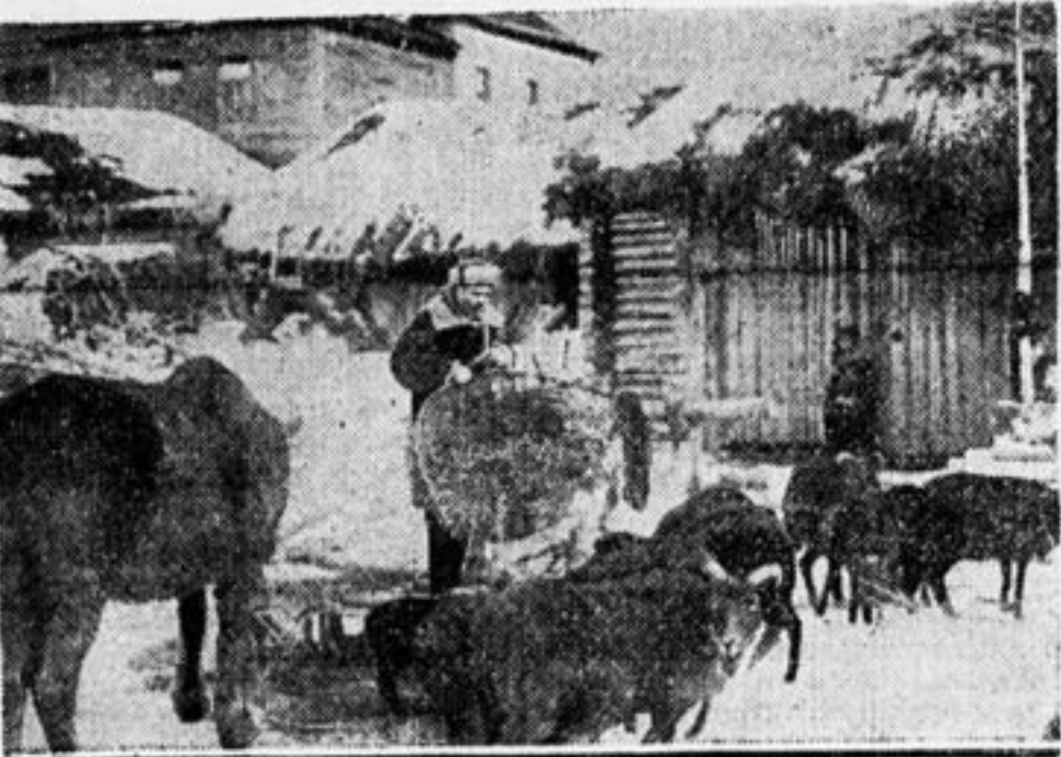
На скотном дворе.

хозяйственные орудия хранить легко: достаточно связать и положить в сухое место. Это нужно делать ежегодно. Крупную машину надо разобрать, обма-