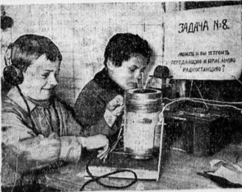
В одном из уголков Ц. Д. технической станции.

сят (А летишь не только ты), И мигает тебе месяц С отдаленной высоты. Деткор БАШМАЧНИКОВ, И.